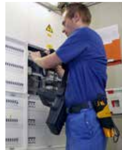
Überprüfung der Elektroinstallation