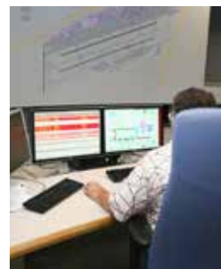
Störungsbehebung im Bereich Technik