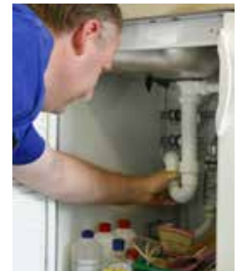
Instandhaltung von Sanitäreanlagen