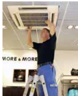
Instandhaltung von Klimaanlagen