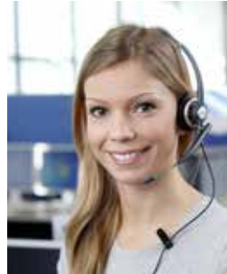
Zentrale Annahmestelle für Störungen

Für ein unverbindliches individuelles Angebot bzw. zur Beauftragung von Leistungen kontaktieren Sie bitte den Vertrieb unserer Fachabteilung: