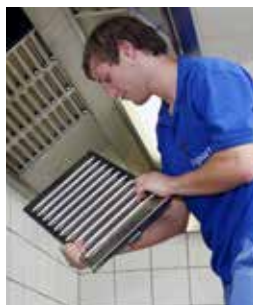
Kontrolle und Austausch von Filtern im Küchenbereich