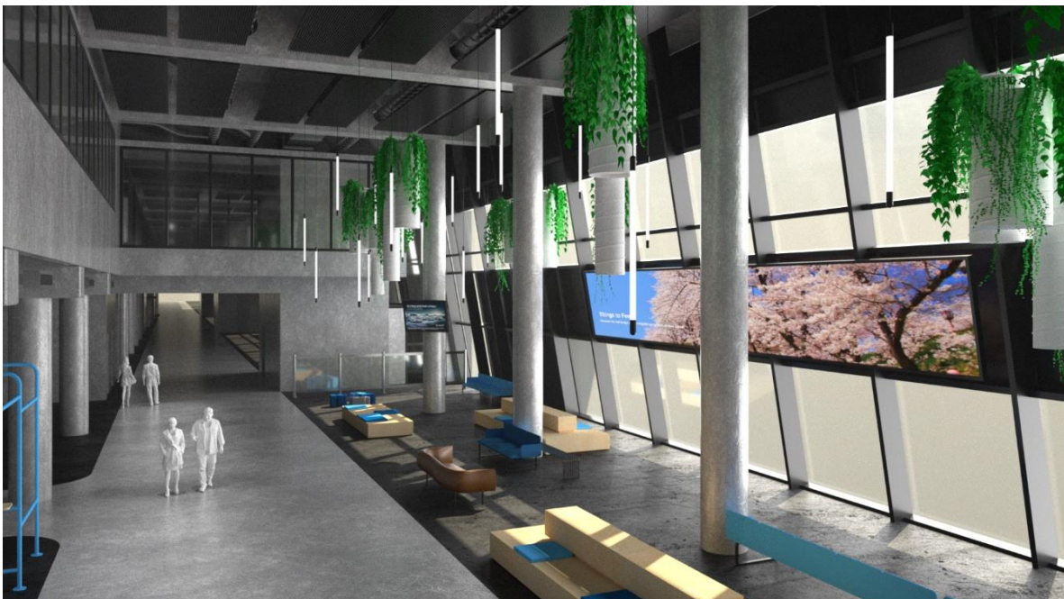
Visualisierung des ausgestatteten Gate-Bereichs in Flugsteig G