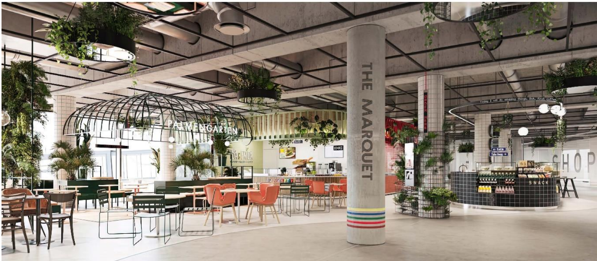
Visualisierung des ausgestatteten Marktplatzes mit Shops und Gastrobereichen